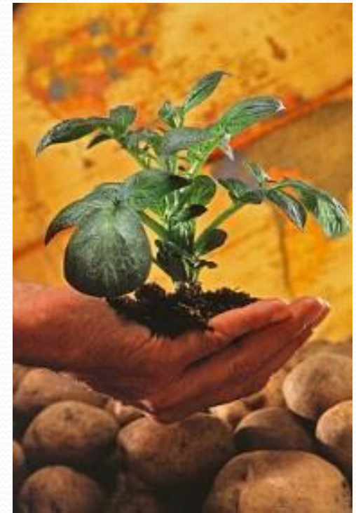
Lilek brambor, též brambor obecný či brambor hlíznatý ( Solanum tuberosum )